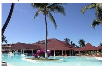
Bravo Andilana – piscina

Cellulari: E' possibile utilizzare telefoni GSM su quasi tutta l'isola.