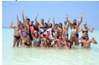
Bravo Andilana – Nosy Be